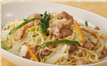
旨味の詰まった濃厚豚骨スープを使った 豚骨塩焼きそば (スープ付)1,600円