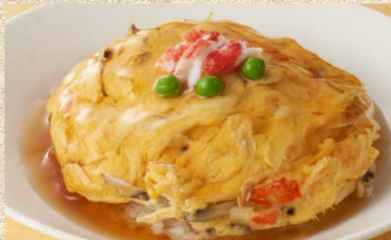
ふゆとろ半熟に仕上げた絶品カニ玉の 天津飯 (スープ付)1,600円