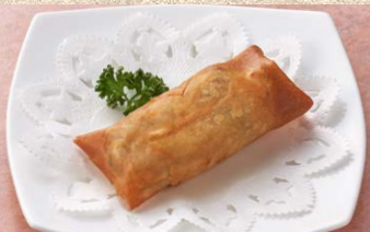
春巻き 1本 400円