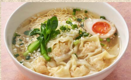
ぷりぷり海老ワンタンをたっぷり乗せた 海老ワンタン麺 1,700円