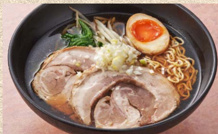
特製の大判チャーシューが入った チャーシュー麺 1,700円