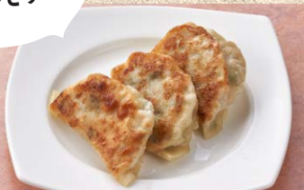
焼き餃子 3ヶ 400円