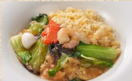
慶楽伝統の五目餡と炒飯の融合 五目餡かけ炒飯 (スープ付)1,600円