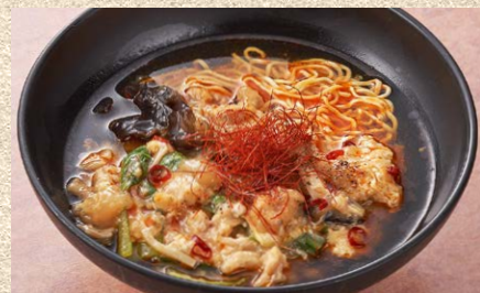
手作り辣油と酸味でやみつきになる 酸辣湯麺 1,700円