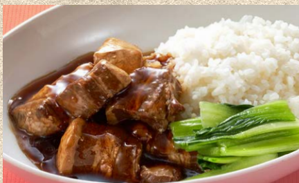
コラーゲンたっぷり皮付き豚肉を使った トンポロー飯 (スープ付)1,700円