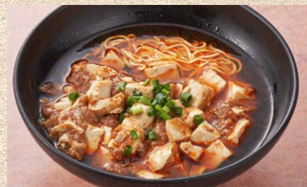
料理長の手作り辣油が香る 麻婆麺 1,600円