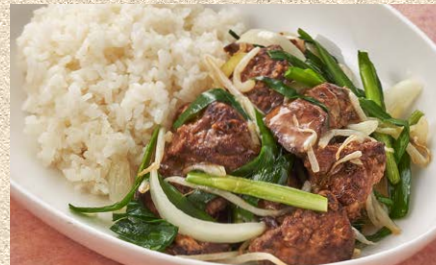
たっぷりのニラと若鶏のレバーを使った レバニラご飯 (スープ付)1,700円