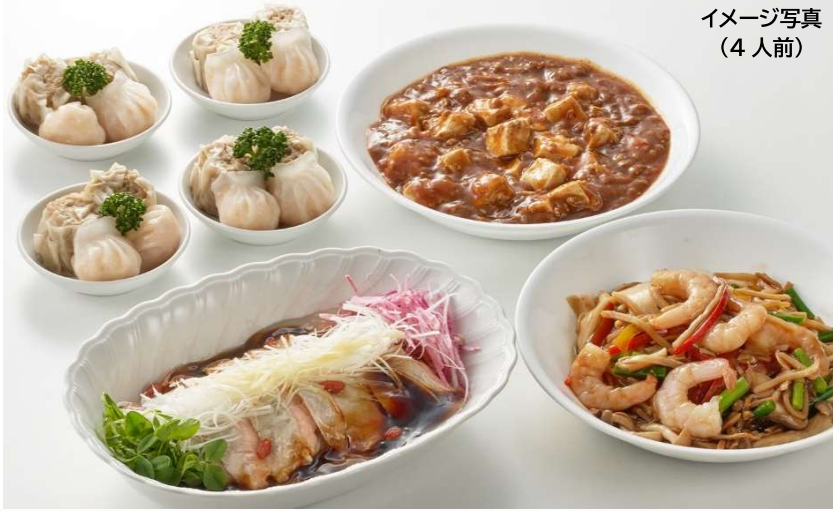
イメージ写真 (4人前)

オンラインショップからも ご予約いただけます！ 新規会員登録で300ポイント & 会員様はポイント1倍付与！