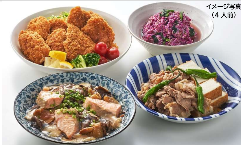
イメージ写真 (4人前)